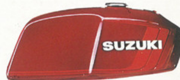
キャンディー・グロス・レッド